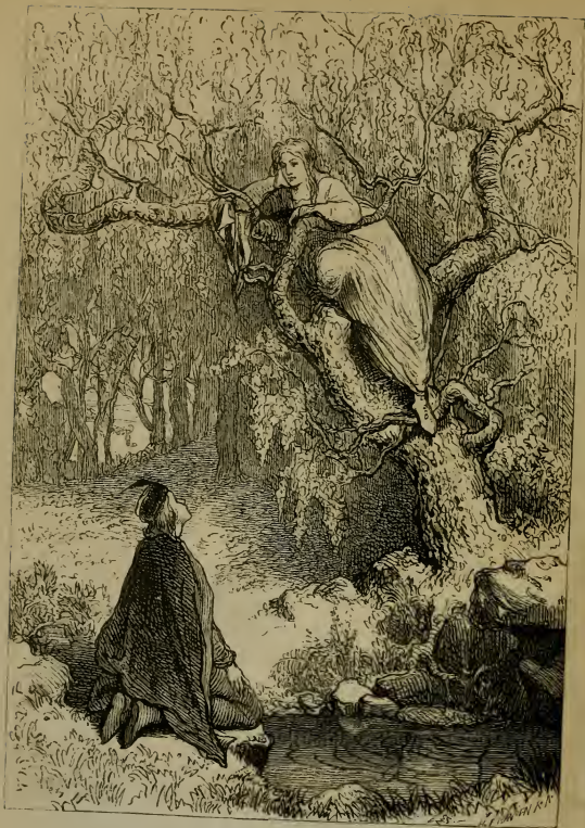
Jungfru Maria som Gudmor.